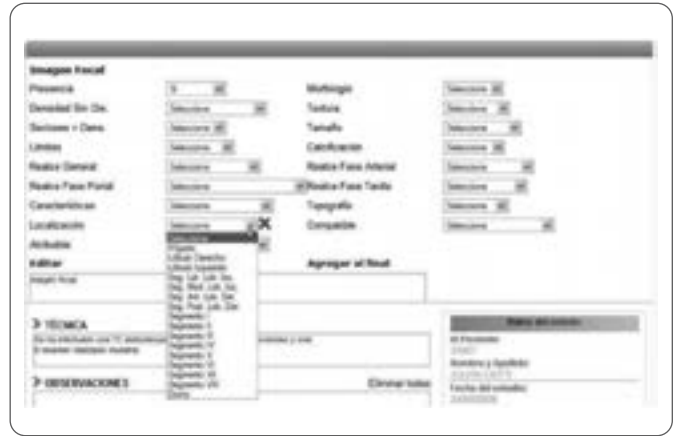
Figura 2. Ejemplo de informe estructurado incorporado a un PACS.

Un informe estructurado debe tener: título del estudio, datos clínicos, estudios previos para comparación, técnica, hallazgos —organizados por subtítulos según el órgano o sistema—, conclusiones —numeradas y jerarquizadas según el orden de importancia (3,8-9)— y, si aplican, recomendaciones y clasificaciones estandarizadas. La estructura propuesta es flexible, pues el informe debe adaptarse al contexto del paciente y ser capaz de responder adecuadamente las preguntas clínicas generadas por los médicos tratantes, es decir, debe estar orientado hacia la enfermedad, no es la mera descripción de la técnica, las estructuras anatómicas visualizadas o los hallazgos identificados.